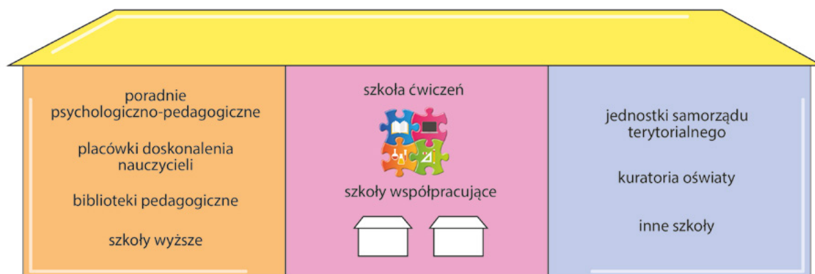
Rys. 3. Organizacja szkoły ćwiczeń

Tak utworzona szkoła ćwiczeń zostanie elementem systemu doskonalenia nauczycieli i będzie realizowała zadania zaplanowane w wyniku wspólnej pracy przedstawicieli szkoły, instytucji wspomagania, szkoły wyższej, kuratorium oświaty i organu prowadzącego szkołę. Tak rozumiana szkoła ćwiczeń będzie więc częścią systemu, wspieraną przez pracowników systemu doskonalenia i szkoły wyższej, ale także zasilana zasobami tych systemów (zob. Rys. 3).