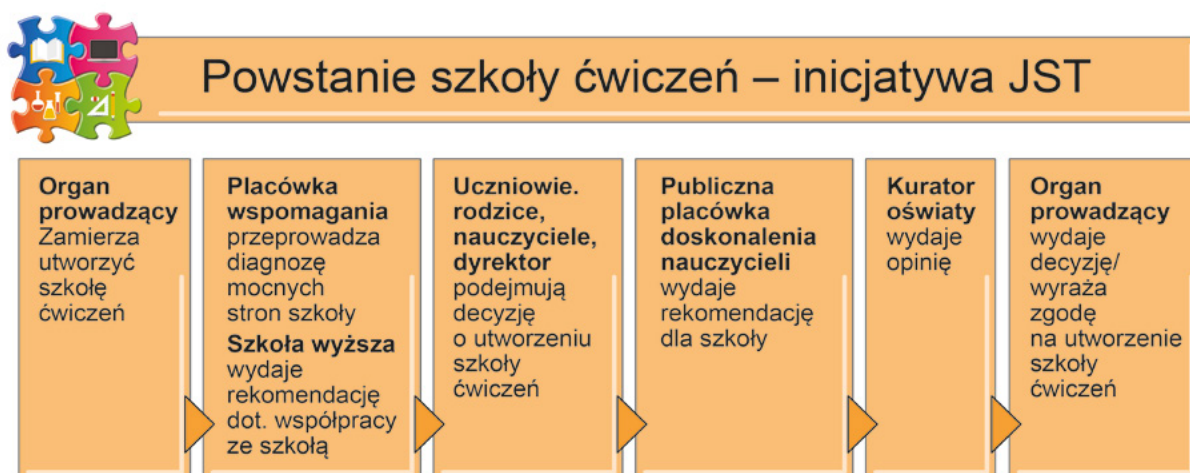
Rys. 2. Powstanie szkoły ćwiczeń – inicjatywa JST

Tak utworzona szkoła ćwiczeń zostanie elementem systemu doskonalenia nauczycieli i będzie realizowała zadania zaplanowane w wyniku wspólnej pracy przedstawicieli szkoły, instytucji wspomagania, szkoły wyższej, kuratorium oświaty i organu prowadzącego szkołę. Tak rozumiana szkoła ćwiczeń będzie więc częścią systemu, wspieraną przez pracowników systemu doskonalenia i szkoły wyższej, ale także zasilana zasobami tych systemów (zob. Rys. 3).