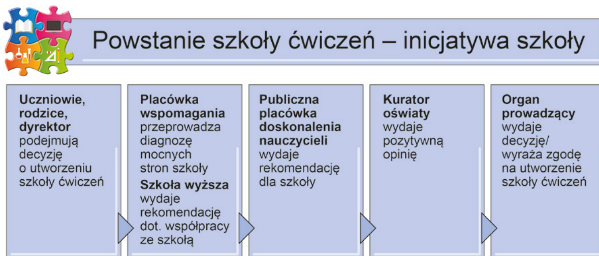
Rys. 1. Powstanie szkoły ćwiczeń – inicjatywa szkoły

Krok szósty: wniosek szkoły do organu prowadzącego szkołę o nadanie szkole statusu szkoły ćwiczeń oraz decyzja organu prowadzącego szkołę o powołaniu szkoły jako szkoły ćwiczeń na okres pięciu lat.