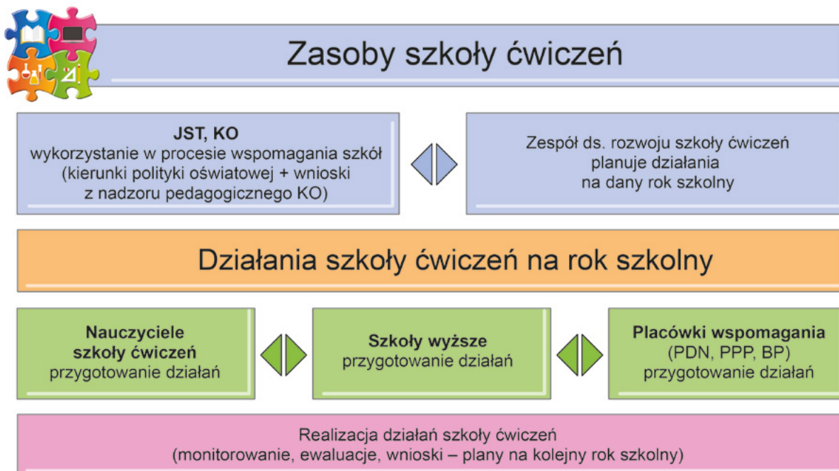
Rys. 5. Funkcjonowanie szkoły ćwiczeń

Informacje uzyskane z ww. źródeł staną się podstawą do postawienia celów oraz w dalszej kolejności zaplanowania działań dla poszczególnych partnerów, ze szczególnym uwzględnieniem oferty placówek doskonalenia nauczycieli, poradni psychologiczno-pedagogicznych oraz bibliotek pedagogicznych. Funkcjonowanie szkoły ćwiczeń przedstawia Rysunek 5.