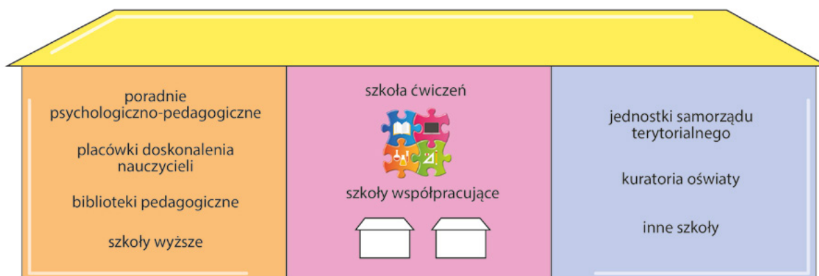
Rys. 3. Organizacja szkoły ćwiczeń

Tak utworzona szkoła ćwiczeń zostanie elementem systemu doskonalenia nauczycieli i będzie realizowała zadania zaplanowane w wyniku wspólnej pracy przedstawicieli szkoły, instytucji wspomagania, szkoły wyższej, kuratorium oświaty i organu prowadzącego szkołę. Tak rozumiana szkoła ćwiczeń będzie więc częścią systemu, wspieraną przez pracowników systemu doskonalenia i szkoły wyższej, ale także zasilana zasobami tych systemów (zob. Rys. 3).